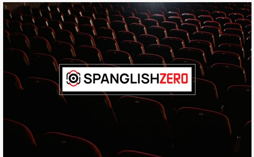
Spanglish Zero: 0% comisión de agente de ventas

El modelo de Spanglish Zero incluye un contrato flexible de seis meses, permitiendo a los productores evaluar resultados sin compromisos a largo plazo. Esta flexibilidad es clave para