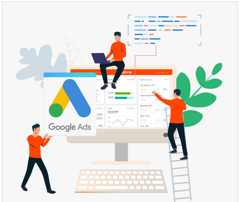
Google AdWords Agentur

Unternehmen, die nach SEO-Beratung für ihre Website suchen, erhalten auch die SEO-Beratungsdienste von ONMA Scout. Seine qualifizierten Fachkräfte helfen Unternehmen, ihre Websites jederzeit und überall ohne Zögern oder zeitliche Einschränkungen zu optimieren. Ob es