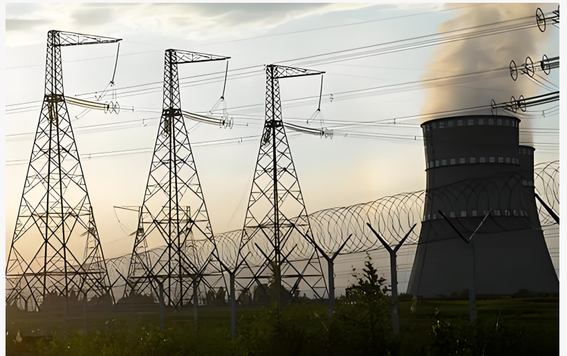
Développement de l'électricité en Afghanistan