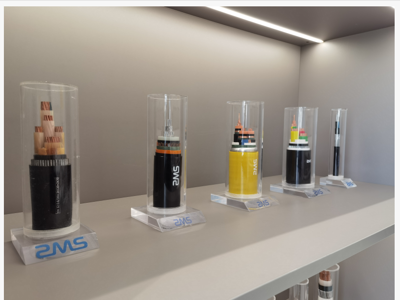
Différents câbles sont produits par ZMS

ZMS dispose d'une ligne de production complète et puissante. L'entreprise propose une large gamme de produits de câbles et offre des services de personnalisation des câbles. Elle produit