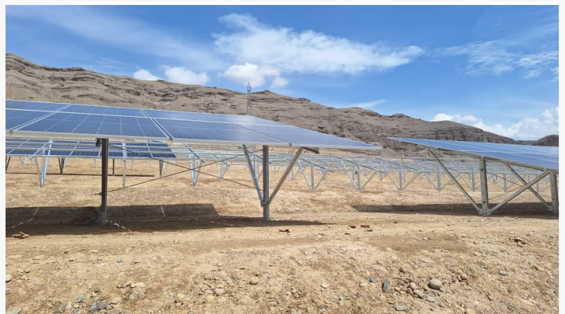
Projet photovoltaïque de 10 MWP à Kaboul, en Afghanistan

L'Afghanistan a lancé un nouveau projet d'énergie solaire visant à produire 10 mégawatts d'électricité, marquant ainsi une étape vers l'autosuffisance énergétique du pays. Financé par le secteur privé pour un coût d'environ 8,9 millions de dollars, le projet se déroule dans le district de Surobi, à 60 km à l'est de Kaboul. Le projet a été lancé le 30 octobre 2023 et vise à connecter le réseau électrique afghan. Il devrait être achevé dans un délai d'un an. Il est enthousiasmant de noter que, jusqu'à la date de rédaction de ce rapport, 70 % des travaux du projet ont déjà été réalisés. Le projet est en bonne voie pour être terminé dans les délais approuvés, d'ici le 19 juillet 2024.