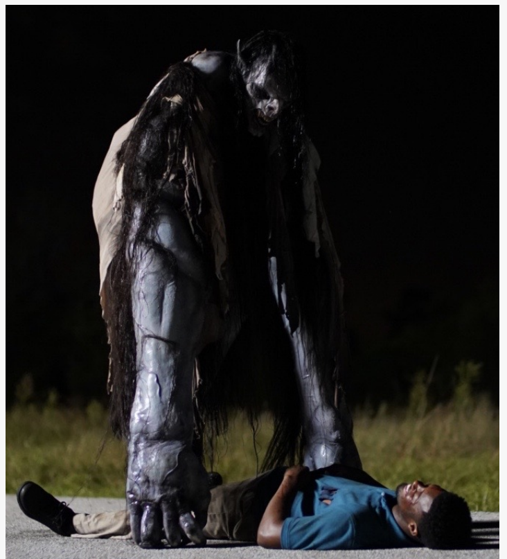
El actor Patrick Walker ("James"), atacado por el monstruo de La Patasola.

This press release can be viewed online at: https://www.einpresswire.com/article/709898226